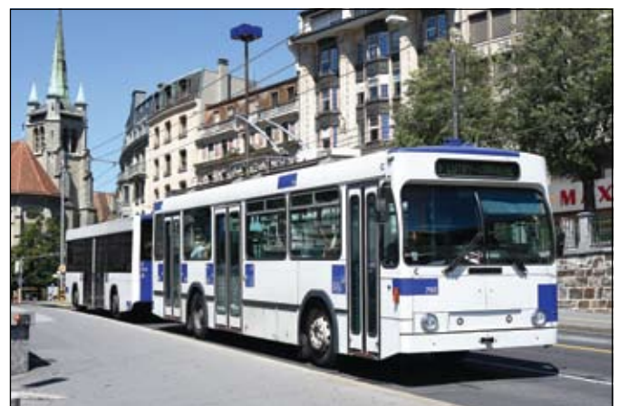
Lausanne (TL): Le 6 août 2016, le convoi formé par le trolleybus 790 (NAW/Lauber/ABB, 1990) et la remorque 929 (Lanz-Marti/Hess, 2007) quitte Saint-François par l'avenue du Théâtre en direction de Lutry.