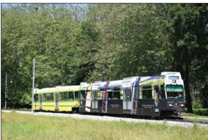
Neuchâtel (Trans N): Ce convoi du Littorail, formé par la Be 4/4 505 et par la Bt 553, fait arrêt au Bas-des-Allées le 20 juin 2016. La motrice est habillée d'une annonce pour les vins et les produits du terroir de Neuchâtel.

Dans l'agglomération bâloise, la pose des voies est en cours sur le prolongement de la ligne de tramway 3 entre Burgfelden Grenze et la gare de Saint-Louis, en France voisine, comme en témoignent quelques images publiées dans Tram 128 . Si l'inauguration de ce tronçon n'est prévue que dans une année, une procédure de consultation publique est d'ores et déjà lancée pour de nouveaux prolongements de cette ligne que nous décrivons dans nos colonnes. Au chapitre du matériel roulant, les BVB ont réceptionné leur première motrice courte de type Bombardier Flexity alors que les BLT ont reçu leur 38 e et dernière motrice de type Stadler Tango.